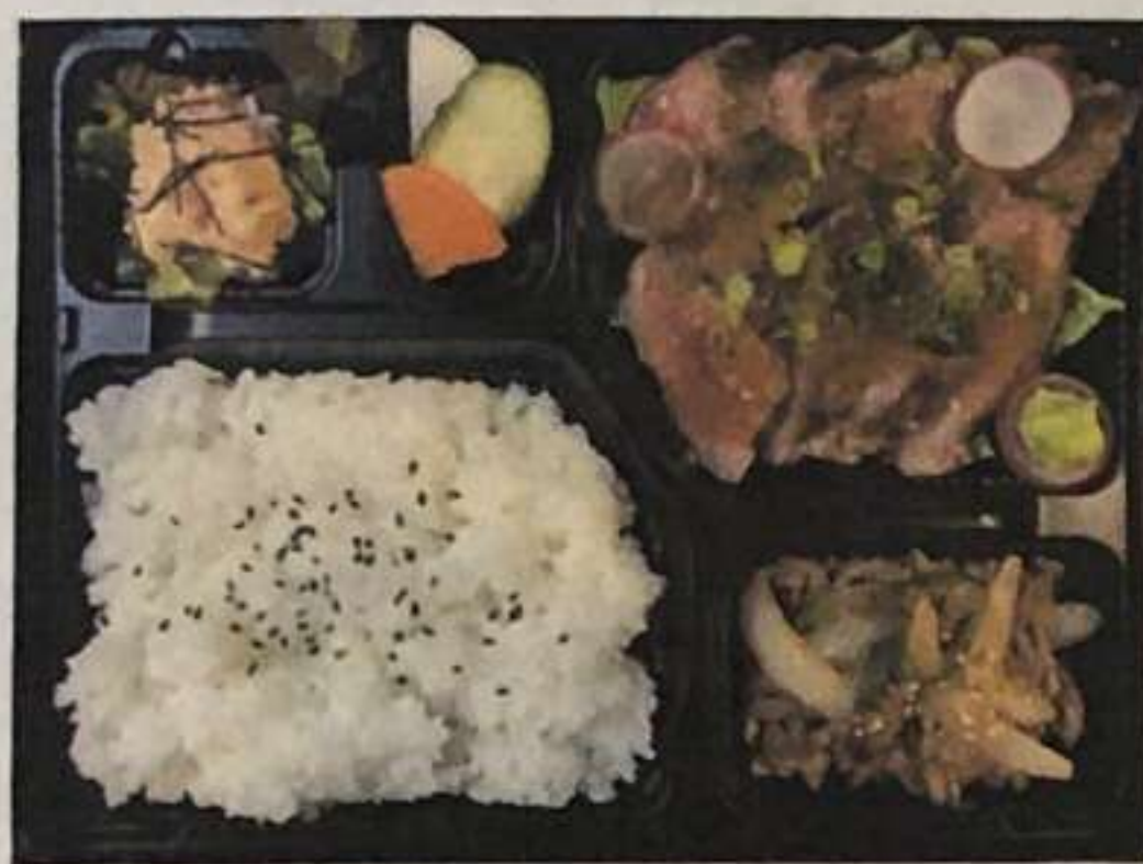
牛サーロインステーキ弁当