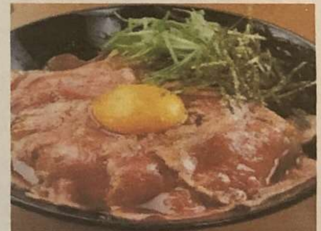
和風ローストビーフ井