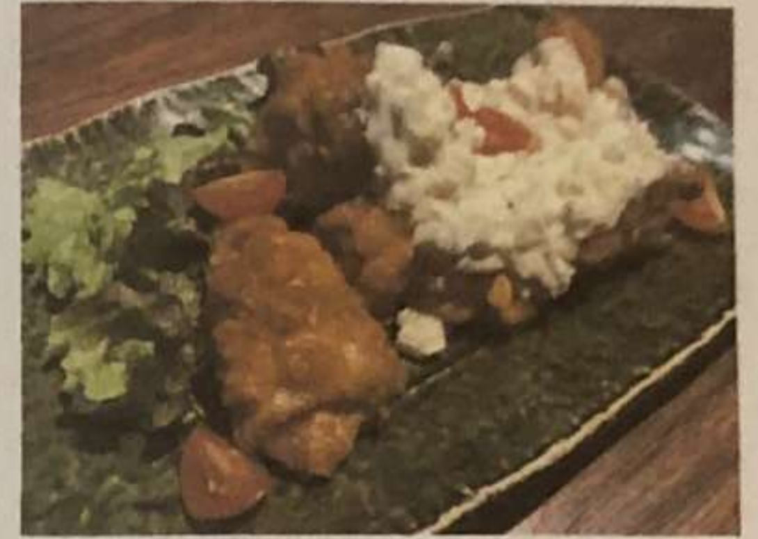
若鶏の唐揚げ チキン南蛮