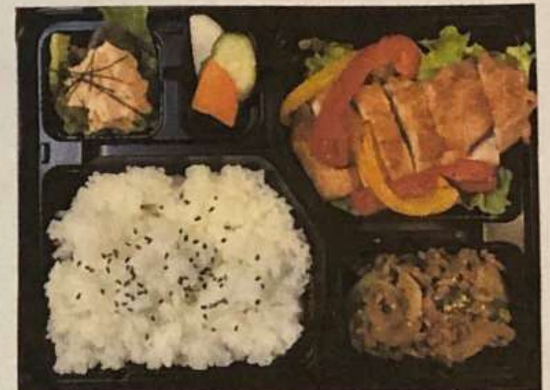
津軽鶏の柚子胡椒焼き弁当