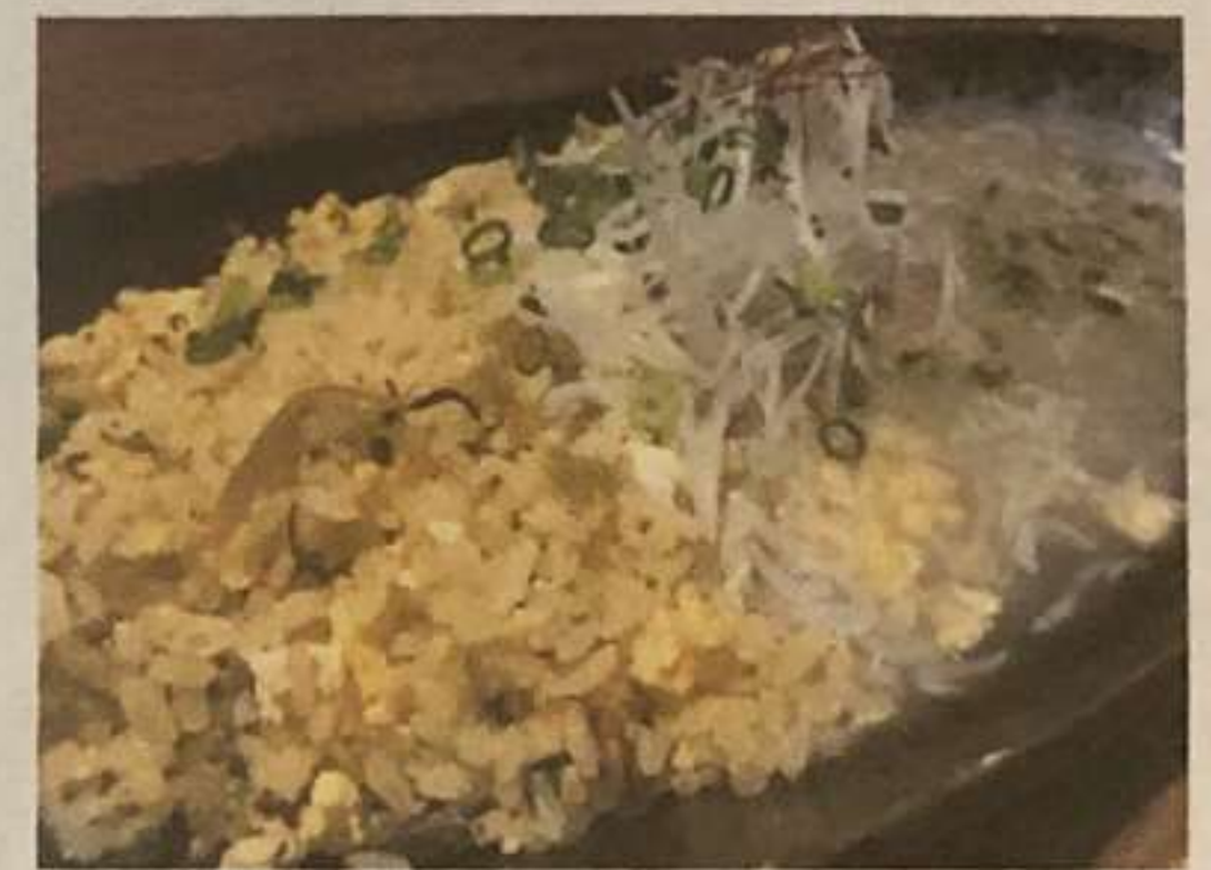
高菜炒飯 しらすあんかけ