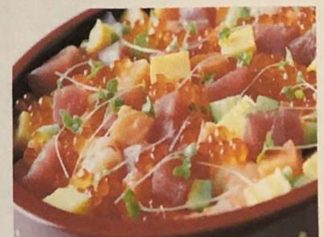
本鮪の入った海鮮ちらし寿司

※お弁当、謎弁、ちらし寿司のご注文は前日までにお願いします。 ※受取時間のご指定をお願い致します。 ※商品は全て税込み価格となっております。 ※お車でご来店の際、お電話頂ければお車までお持ちいたします。