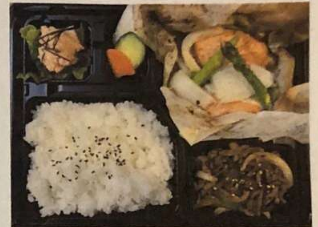
旬魚と旬野菜の紙包み焼き弁当