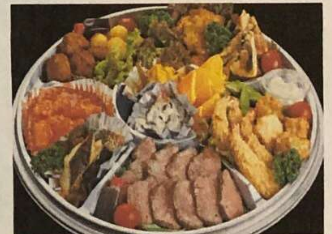
とある日の謎弁6種類

謎弁とは・・・その日のおすすめ料理が盛り込まれた豪華オードブルです。 ご飯は付きません。