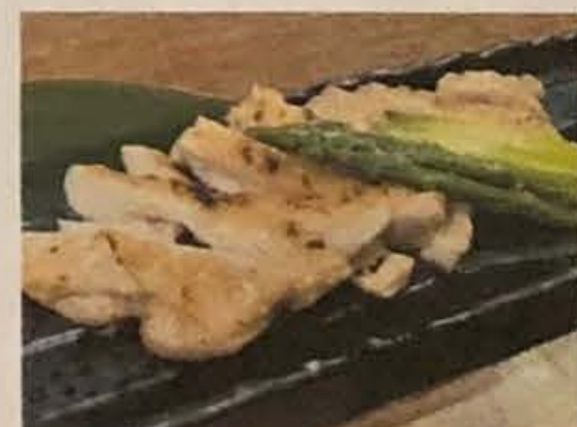
津軽鶏の柚子胡椒焼き