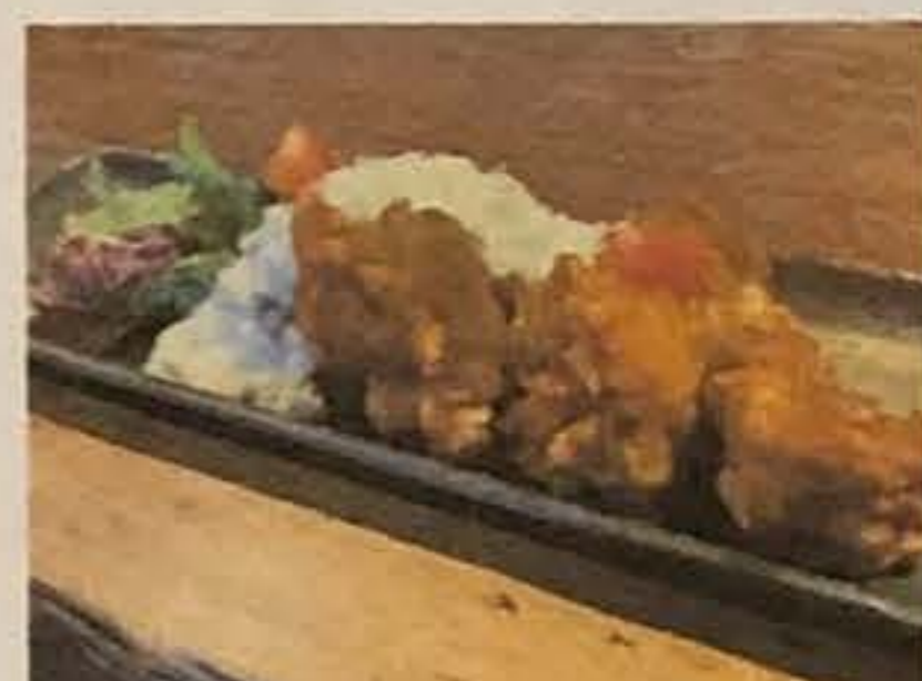
若鶏の唐揚げ チキン南蛮