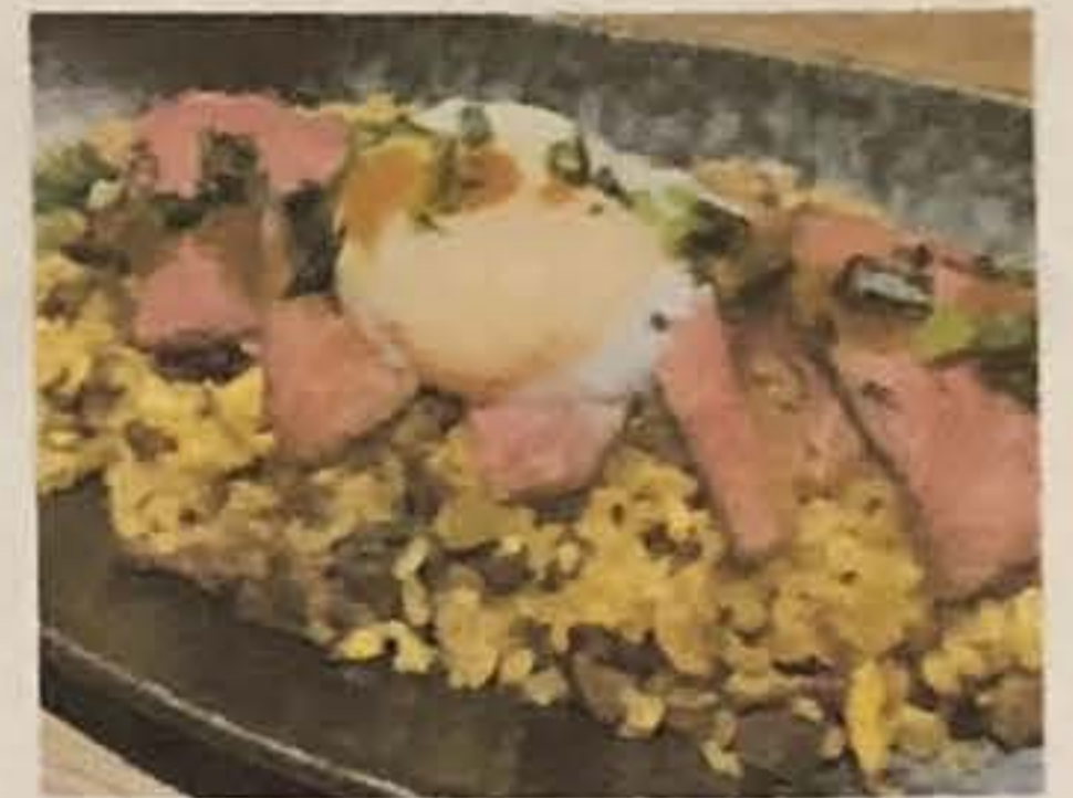
ガリバタ肉チャーはん