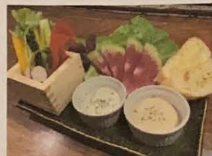
旬野菜の和風バーニャカウダ