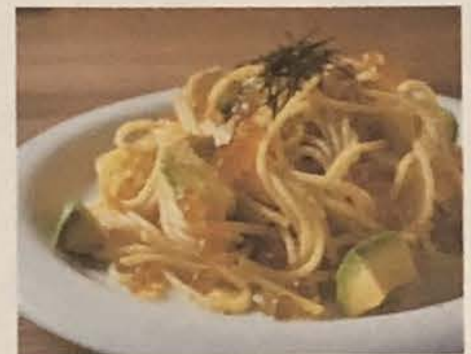
アボカドとイクラのわさび醤油パスタ