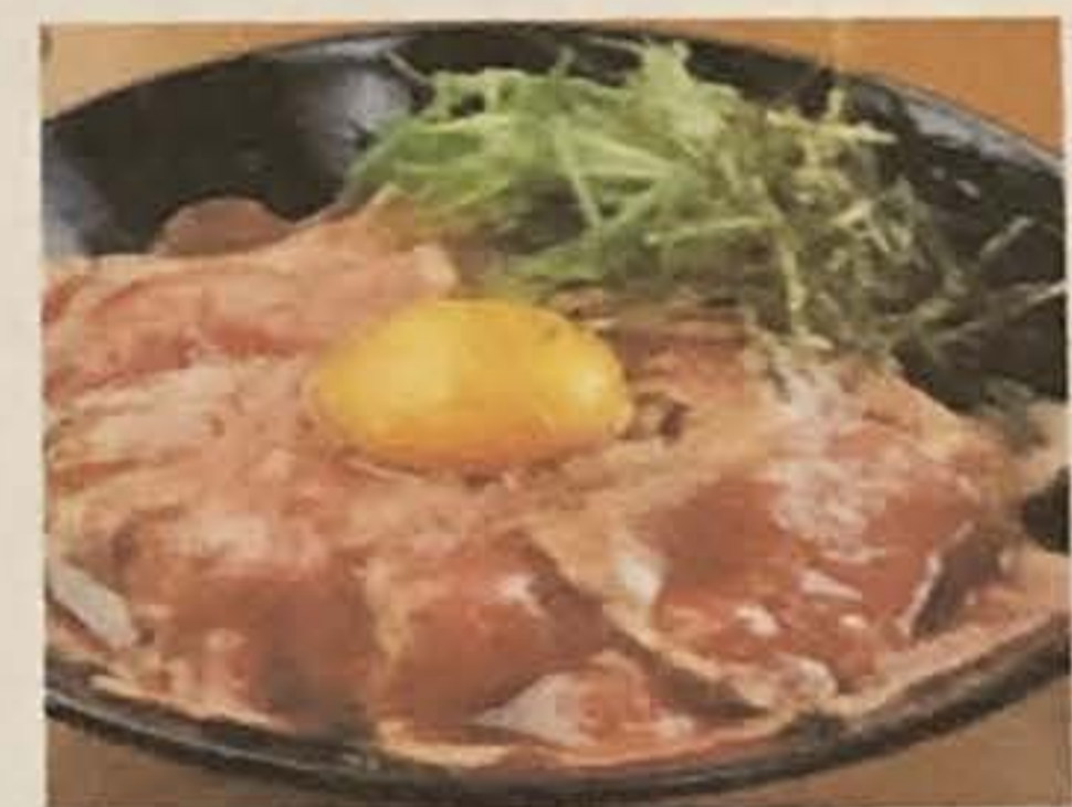
和風ローストビーフ丼